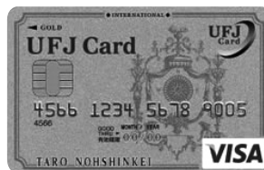
(2) UFJ ニコスクレジットカード

受付には (1) 会員証のみ持参してください。(2) UFJ ニコスクレジットカードの持参は不要です。